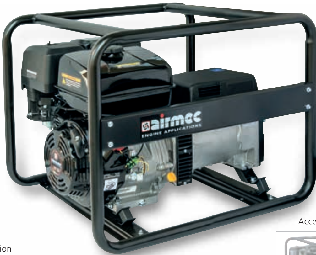
Accessorio - Accessory