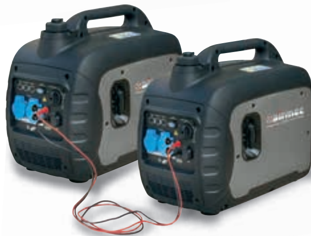
Collegabile in parallelo Connected in parallel

LED display pilot lamp e power indicator.