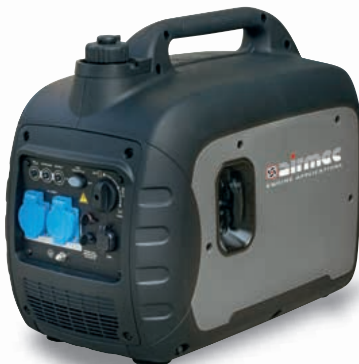
Ingresso Usb Usb plug